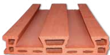
PIEZA CERÁMICA (500 x 320 x 60)