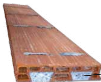
TABLERO CERÁMICO PRETENSADO "BARDOPRET" TERMINADO