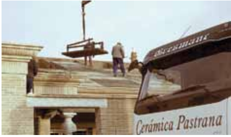
Sin mano de obra