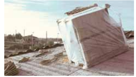
Seguridad y resistencia