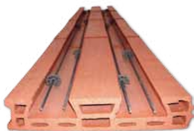
UNIÓN DE PIEZAS CERÁMICAS CON ALAMBRE PRETENSADO