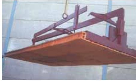
Rapidez de montaje