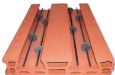
PIEZA CERÁMICA CON ALAMBRE PRETENSADO