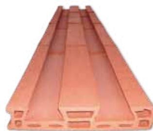
UNIÓN DE PIEZAS CERÁMICAS PARA LOGRAR MEDIDA NECESARIA